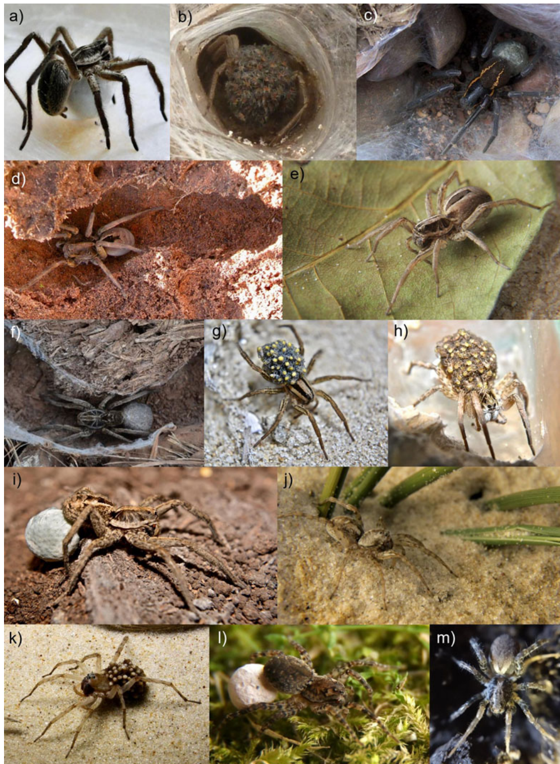
Fig. 1. Imágenes de algunas de las especies de licósidos estudiadas: a) Aglaoctenus lagotis (forma norte) construyendo una ooteca, b) Aglaoctenus lagotis (forma sur) con crías en su tela, c) Aglaoctenus oblongus con ooteca en tubo, d) Lycosa erythrognatha en su refugio, e) Lycosa inornata , f) Lycosa poliostrata con ooteca en su refugio, g) Lycosa u-album con crías, h) Pavocosa gallopavo con crías, i) Schizocosa malitiosa con ooteca, j) Allocosa marindia , k) Allocosa senex con crías, l) Paratrochosina amica con ooteca, m) Pardosa flammula .