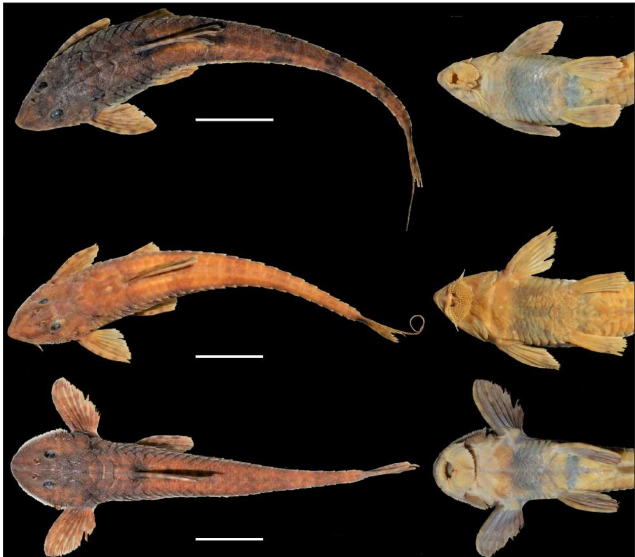
Fig. 1. Rineloricaria sanga (arriba) ZVCP 13866; Rineloricaria stellata (medio) ZVCP 8826; Rineloricaria zaina (abajo) ZVCP 13933. Izquierda = vista dorsal; derecha = vista ventral. Escala = 20 mm.

tres a cinco series de placas; extremo distal de las aletas pectorales plegadas llegan un poco más allá de la inserción de las aletas pélvicas; presencia de filamento en el radio superior de la aleta caudal. Otro carácter importante para distinguirla de otras especies de Rineloricaria es la presencia de 4 series de placas laterales.