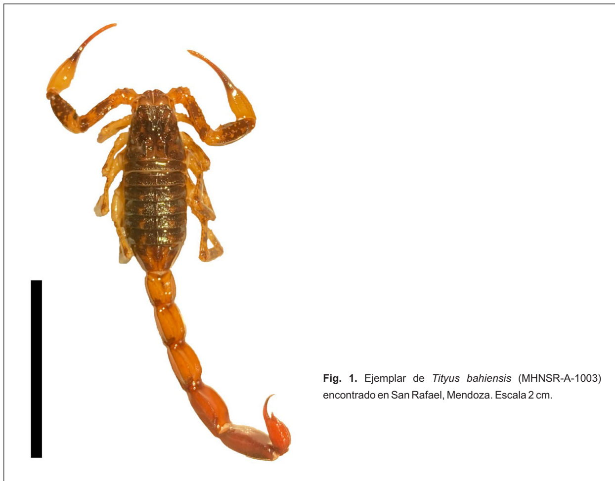
Fig. 1. Ejemplar de Tityus bahiensis (MHNSR-A-1003) encontrado en San Rafael, Mendoza. Escala 2 cm.

MCTox1Artr0001) (de Roodt et al., 2019). El presente trabajo tiene como objetivo dar a conocer el primer registro de un ejemplar T. bahiensis en la provincia de Mendoza, en la región centro oeste de Argentina.